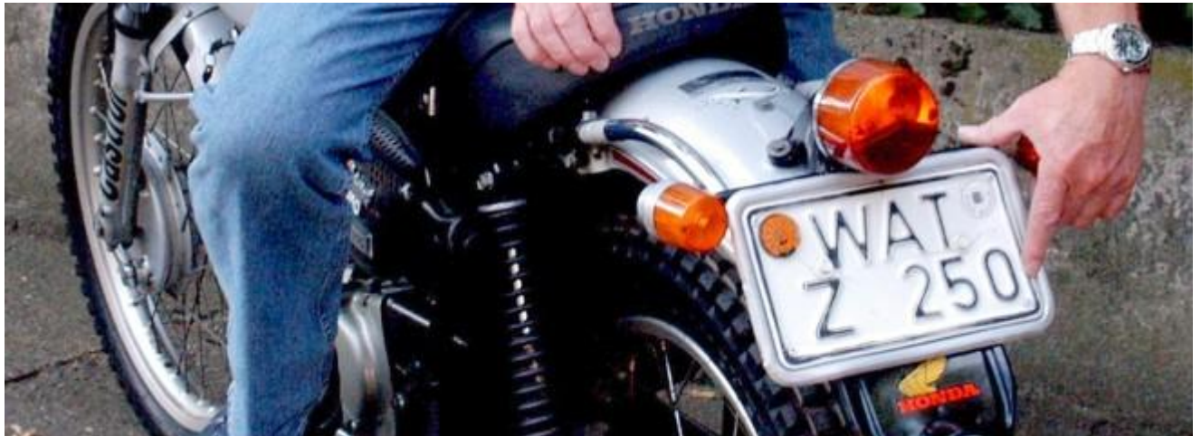
Wattenscheid Serie, WAT-Kennzeichen