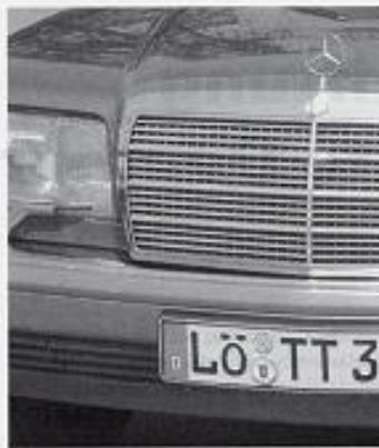
Ausfahrer haben einen Bezug zu ihren Kennzeichen.

wisse Größe assoziiert – vor allem aber erhöht sich der Bekanntheitsgrad. Oft hat diesen Nutzen allerdings allein die Kreisstadt, was als ungerecht anzusehen ist: So wird RE als „Recklinghausen“ identifiziert und nicht als „Kreis Recklinghausen“. Dass Städte wie Gladbeck oder Castrop-Rauxel sich auch hinter dem Kreis Recklinghausen „verbergen“, nehmen Auswärtige in der Regel nicht wahr. Gladbeck und Castrop-Rauxel verzichten dabei auch auf die innere Symbolisierung durch GLA oder CAS. Hier besteht eine ungleiche Kosten-Nutzen-Zuordnung: Die Bürger Gladbecks oder Castrop-Rauxels finanzieren die Symbolisierung der Marke Recklinghausen.